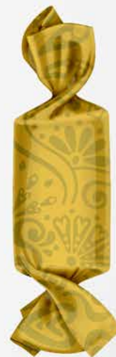
ساشه های دوسریچ