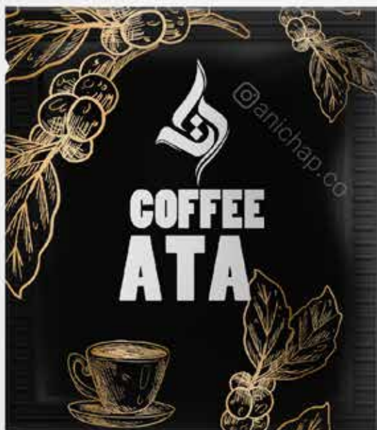
ساشه های مربع