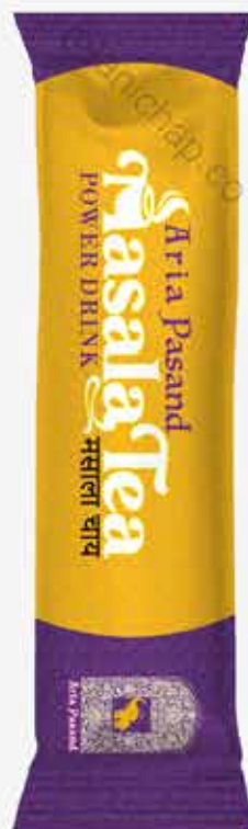
ساشه های مدادی